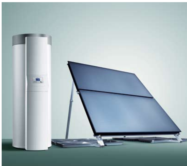
auroSTEP plus - komplet solvarmeanlæg med 1 - 3 solfangere.