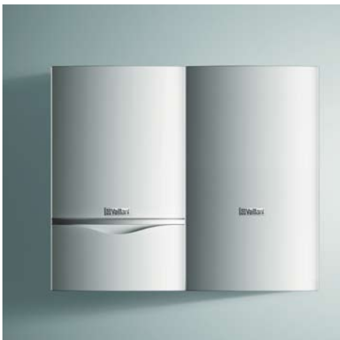
ecoTEC exclusiv med varmtvandsbeholder uniSTOR VIH CB 70