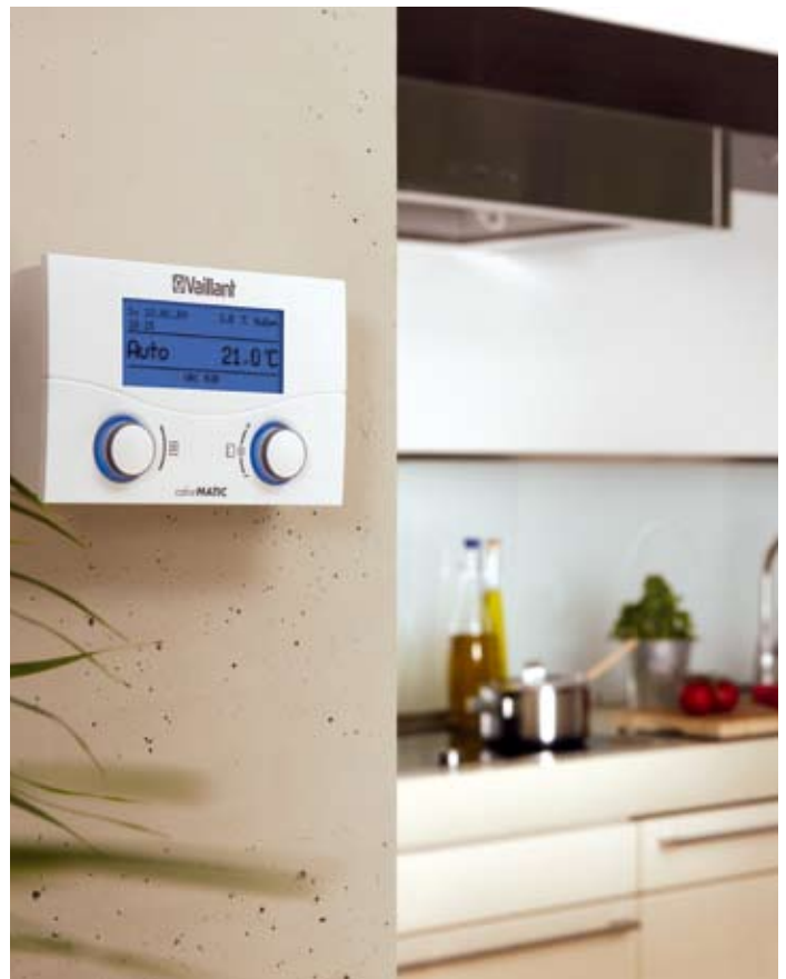
calorMATIC 430 anvendt som fjernbetjening og rumtermostat.

calorMATIC VRT 392f byder desuden på trådløs dataoverførsel - herved undgås synlige kabler og installation heraf.